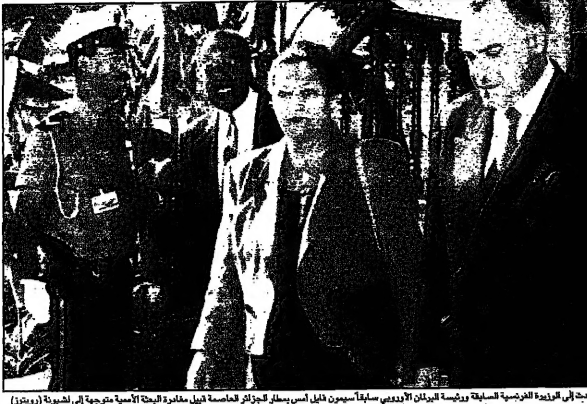
المستشارين بجند في الزيارة الفرنسية السابعة ورئيسة البرلمان الأوروبي سيمون ديلاس...